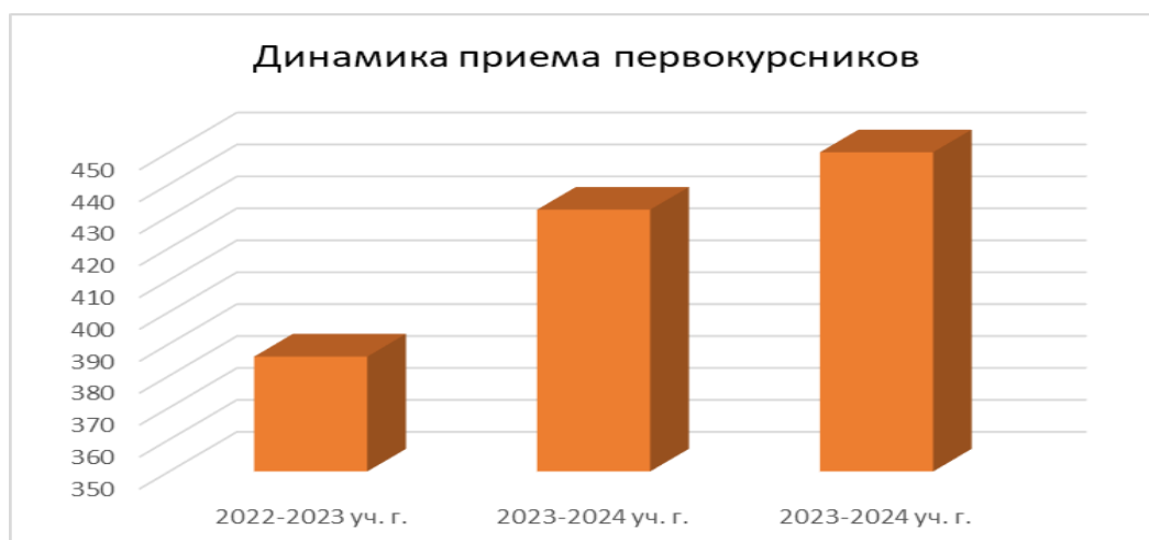
Рис.1. Число первокурсников в 2022, 2023, 2024 годах.

Так в 2022 году в ГБПОУ МО «Можайский техникум» поступило 382 первокурсника. В 2023 году показатель увеличился и составил 428 первокурсников. В 2024 году число первокурсников увеличилось и составило 450 студентов (наглядно динамику увеличения числа первокурсников можно рассмотреть на рисунке 1).