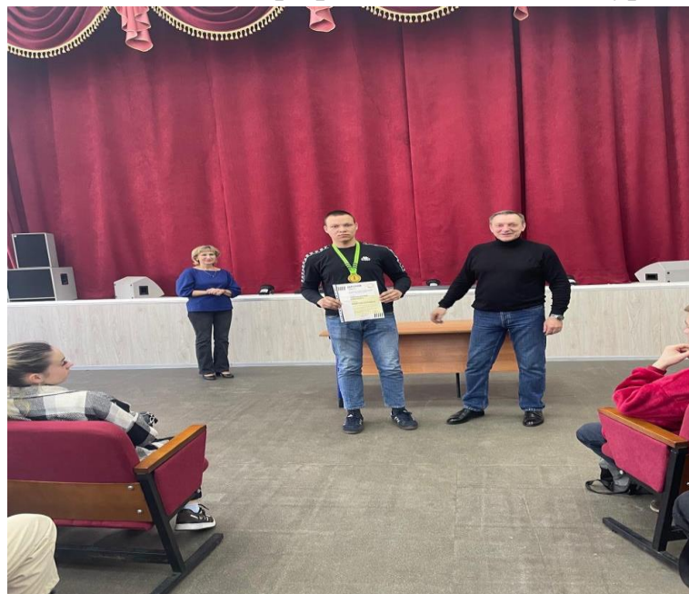
Рис.3. Фото встречи с победителем профессионального конкурса

- «Давайте познакомимся». Цель данного мероприятия – создать условия для знакомства друг с другом в условиях вне учебной работы. Наставники группы знакомятся с первокурсниками, представляясь им, рассказывая о себе, о своем опыте адаптации, о своих интересах, о значимых мероприятиях, в которых первокурсники обязательно должны принять участие. Встреча с выпускниками техникума разных специальностей и разных поколений, с победителями профессиональных конкурсов;